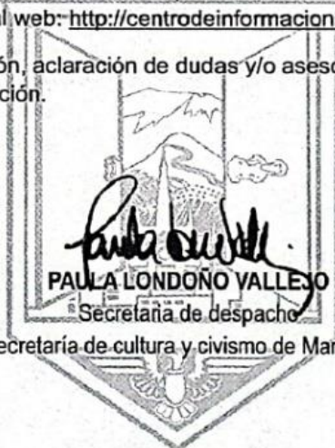
Secretaría de cultura y civismo de Manizales

Por favor para más información, aclaración de dudas y/o asesorías en la materia, utilice únicamente estos dos canales de información.